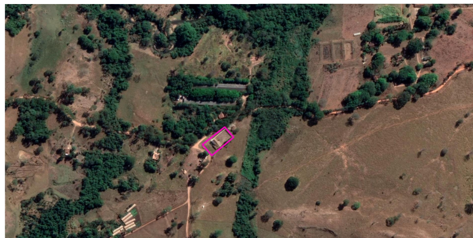
IGREJA DO FERREIRO