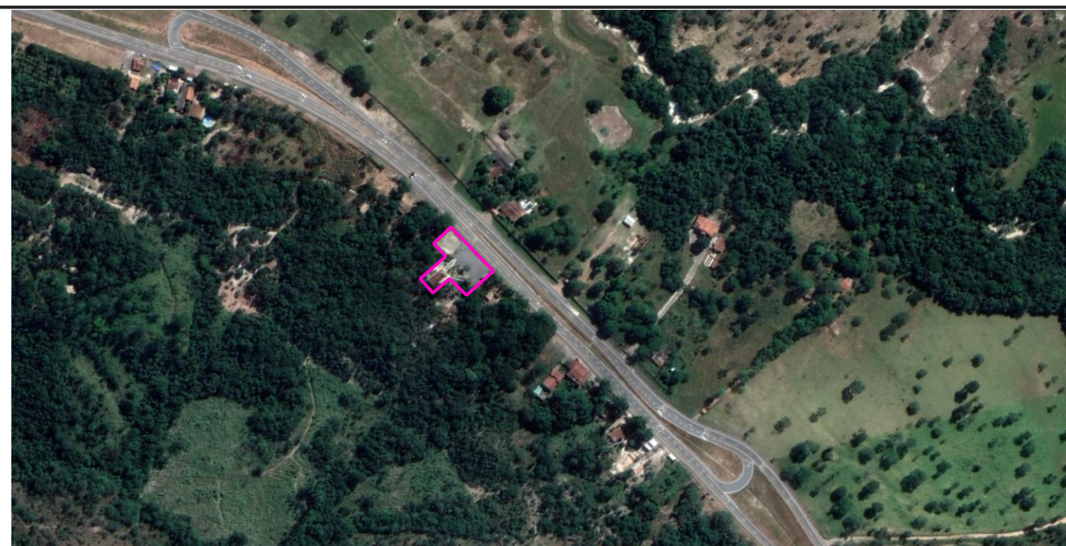
IGREJA NOSSA S. APARECIDA - POVOADO DE AREIAS