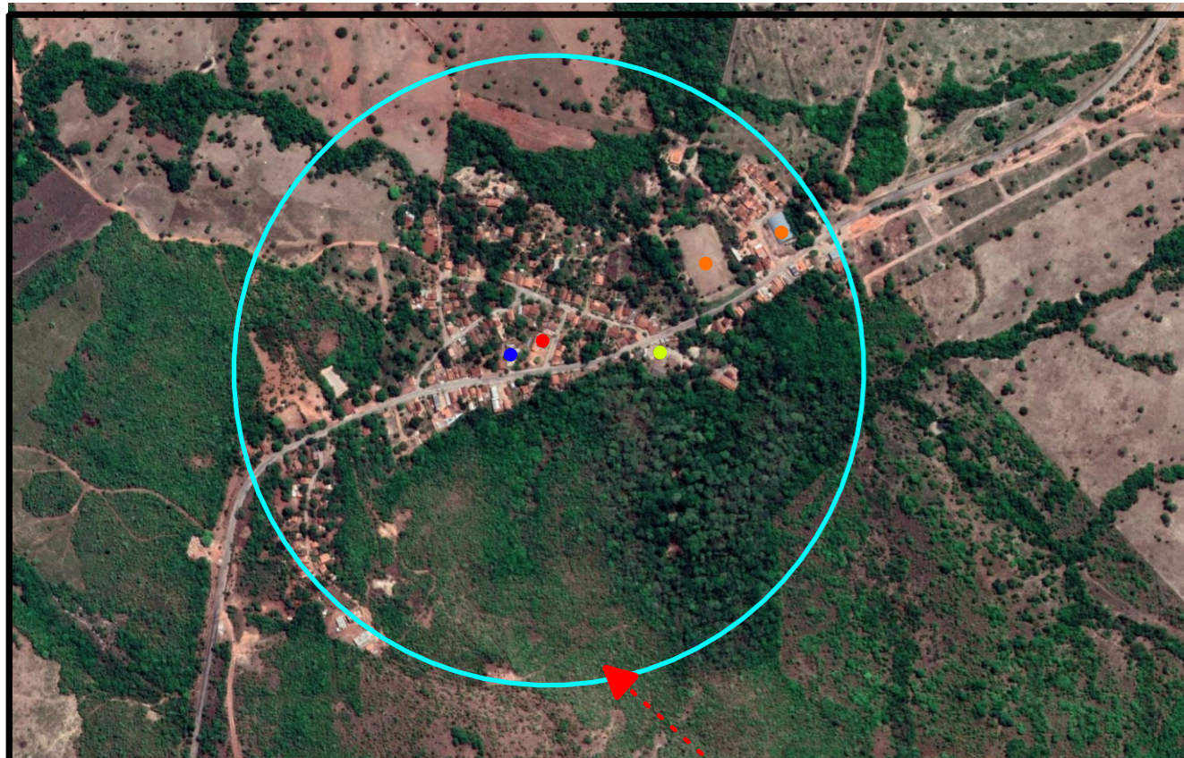
DISTRITO DE ÁGUAS DE SÃO JOÃO