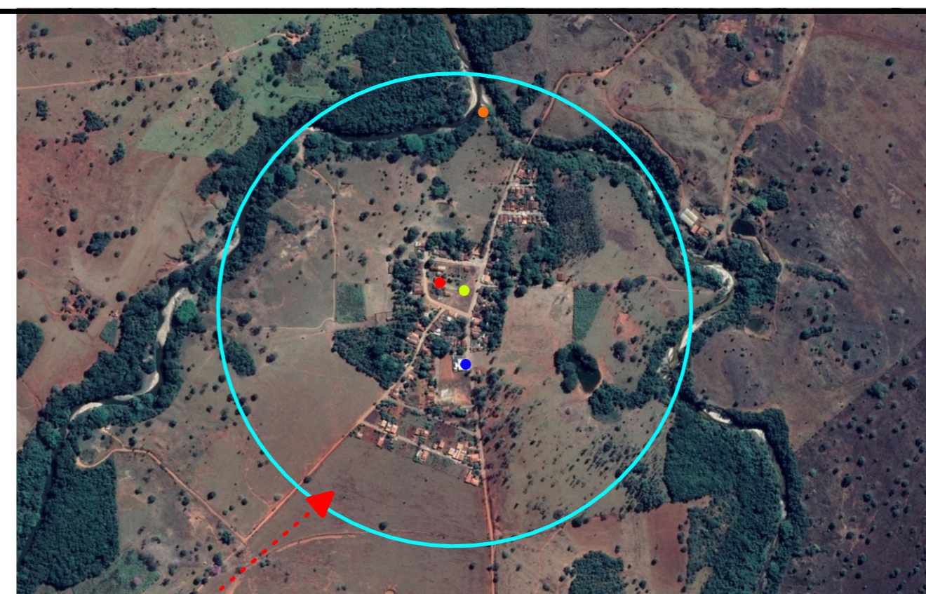
DISTRITO DE BUENOLÂNDIA